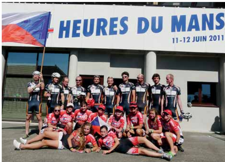
Na medailové pozici na slavné automobilové trati ve francouzském Le Mans dosáhli olomoučtí in-line bruslaři.

Těsně pod stupni vítězů skončila desetičlenná štafeta žen Tempish in-line Girl. Obhájkyně bronz se po roce musely spokojit se čtvrtou příčkou, i když podaly mnohem lepší výkon než loni. Ujely téměř o třicet kilometrů víc, přesto to tentokrát na medaili nestačilo. „Pro nás je důležité znatelné zlepšení výkonů všech holek, což potvrdilo také absolutní pořadí, kde náš tým skončil na 42. místě ze 416 štafet,“ uvedl Hromádka. (šed)