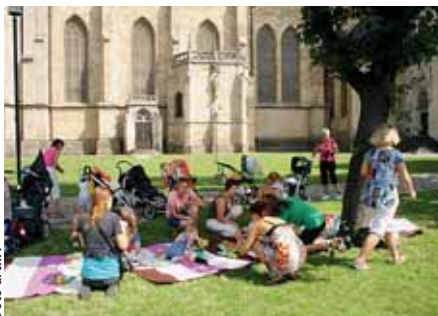
Součástí neobvyklých prohlídek města bývá i malý piknik.

Prohlídky jsou vždy na objednávku od dubna do října. Cena pro skupinu od deseti dětí je 30 korun za dítě, doprovod zdarma.